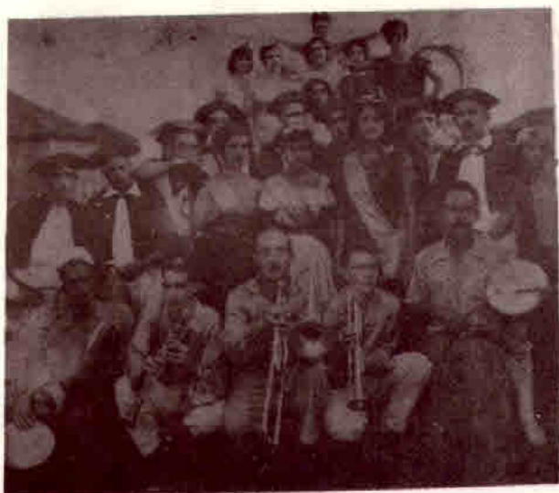
1957 - Carnaval