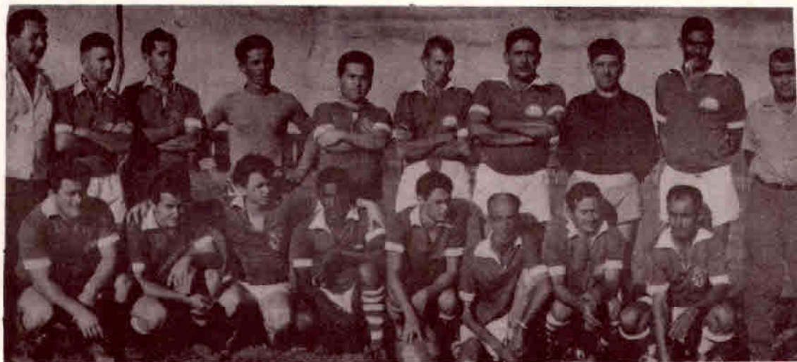
1960 - GUARACI F.C. (Veteranos)