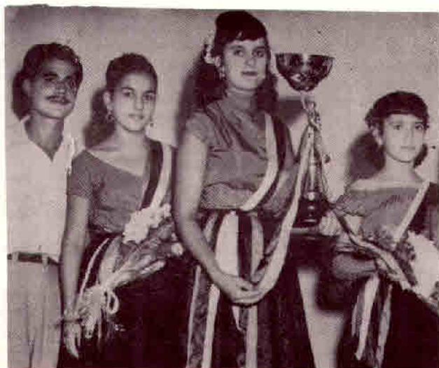
1956 - Carnaval