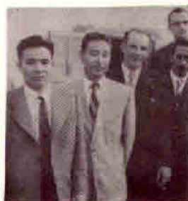
1954 - Pioneiros