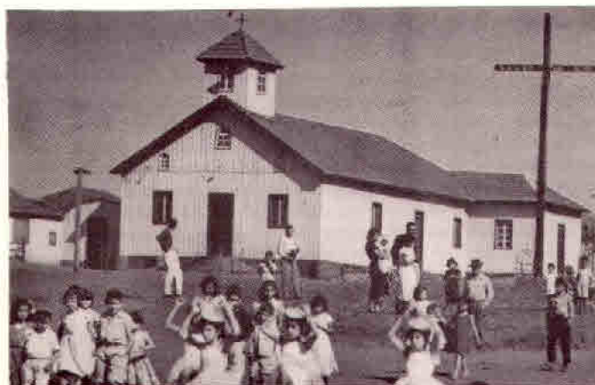
1956 - Segunda Igreja