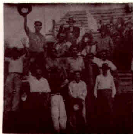
1955 - Pioneiros