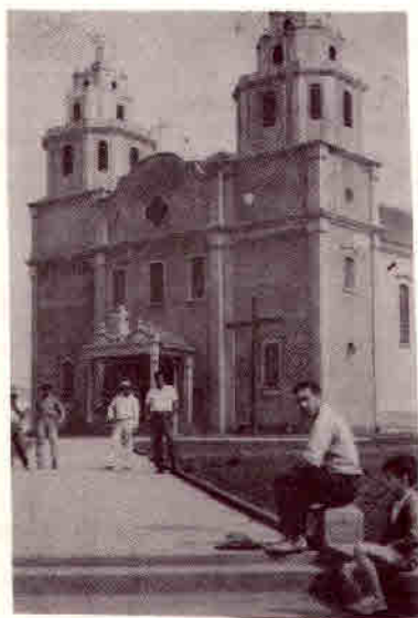
1962 - A Igreja atual