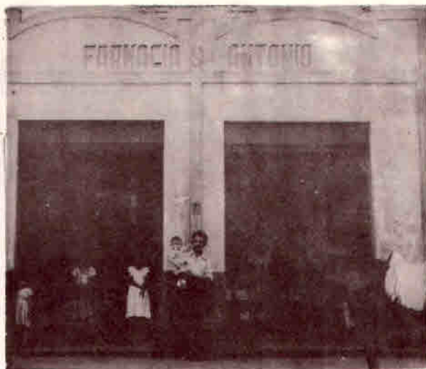
Farmácia Santo Antonio (Primeira farmácia do Carvalho).