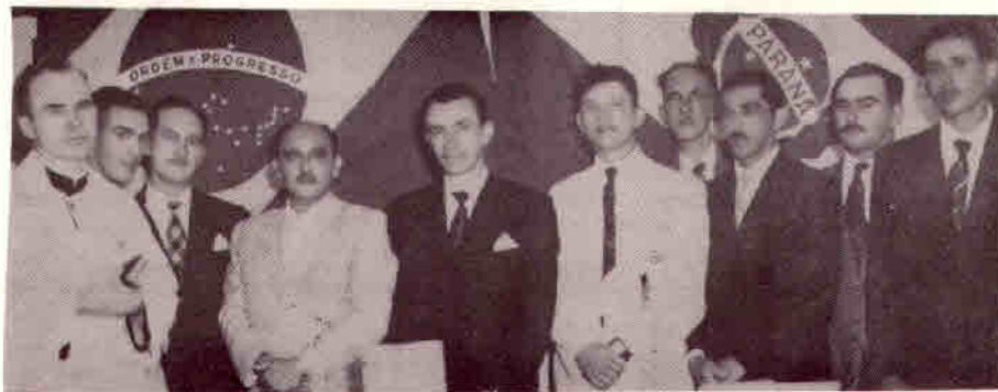
1954 - Posse da Primeira Câmara, e Prefeito