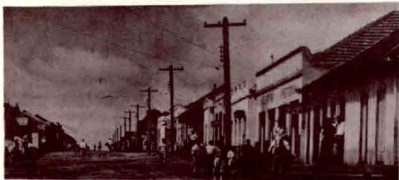
1957 - Vista da Rua Principal