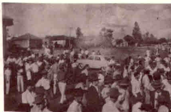
- Vista do povoado