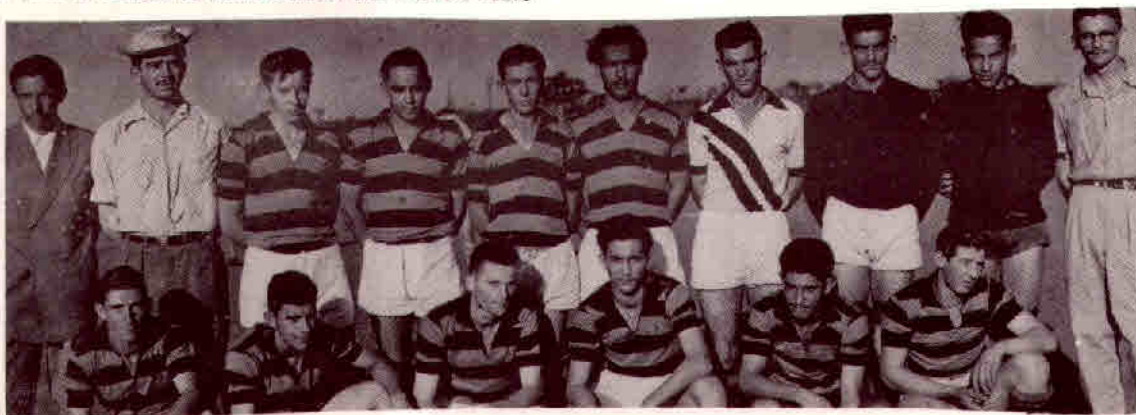
1956 — Sociedade Recreativa Guaraci (principal equipe da região). Recebeu e venceu em seu campo as equipes do Arapongas — XV de Jaú-SP, Cambé AC, Ferroviária de Araraquara,